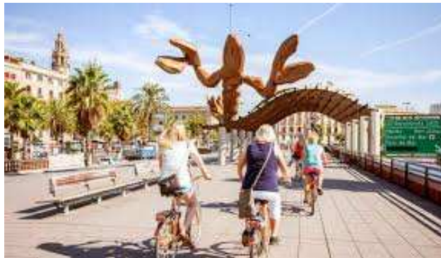
Barcelona en España