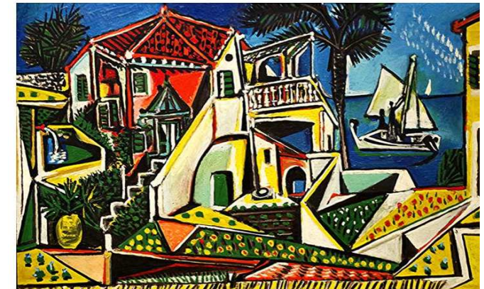
Picasso, Paysage méditerranéen, 1953 (pintor español)