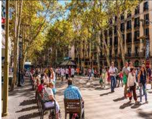
Las Ramblas de Barcelona en España