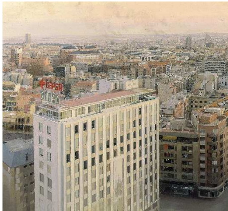
Antonio López, Madrid desde Torres Blancas (pintor español)

Documento 2: Photolangage "La ciudad, única y distinta"; montage de tableaux de peintres e métropoles espagnoles ou latino-américaines.