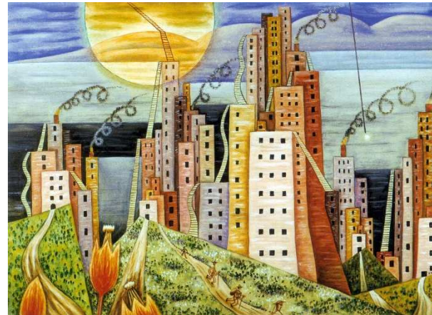
Alejandro Xul Solar, Ciudad Lagui, 1939 (pintor argentino)