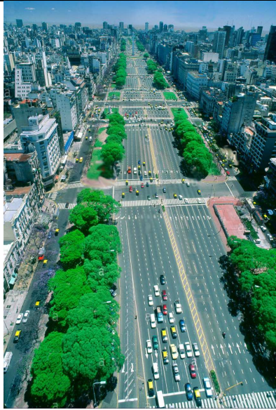
La megalópolis del gran Buenos Aires en Argentina