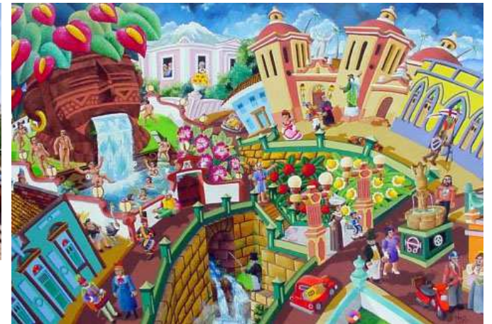
Hernando Nossa, El Pescador , 2004 (pintor colombiano)