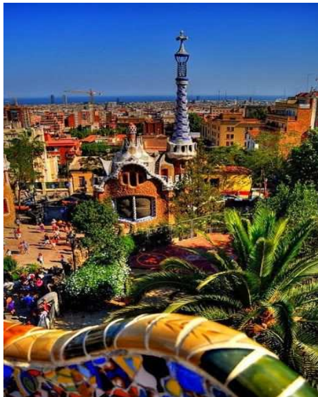
El parque Güell , Barcelona en España