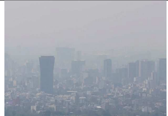
La Ciudad de México

Documento 3: Peinture murale de John VALADEZ, A Day in El Paso del Norte, 2008, pintura mural en el R.C. White Federal Building, El Paso, Texas.