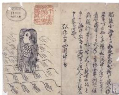
江戸時代のアマビエ

Tu l'auras compris, Amabie a le pouvoir de guérir les personnes malades grâce à son image. Toi aussi, pourquoi ne dessinerais-tu pas ton Amabie ? Voici plusieurs représentations d'Amabie dont tu peux t'inspirer !