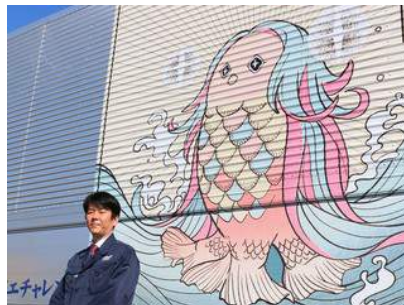
③ トスリートアトー