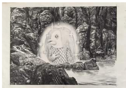
水木しげるのアマビエ