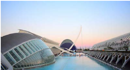
Ciudad de las artes y las ciencias, Valencia, España. Santiago Calatrava, 1998.