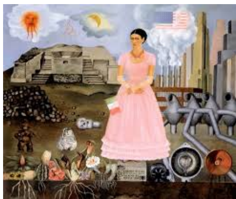
Autorretrato en la frontera entre México y Estados Unidos (Frida KHALO, 1932)