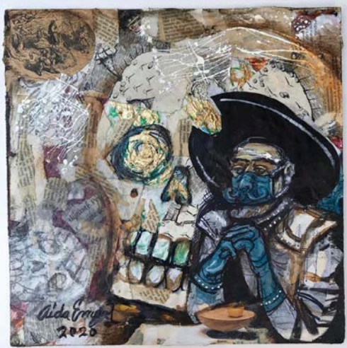
Aida EMART, artista mejicana, abril 2020