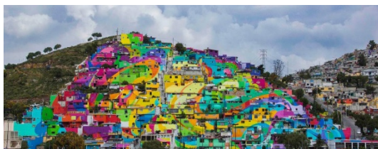
Pachuca, arte urbano para renovar una favela mejicana (2015)