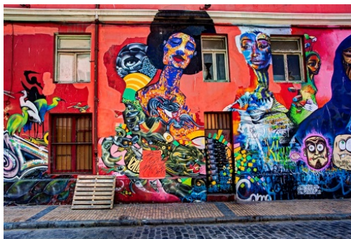
Arte urbano, Valparaíso, Chile