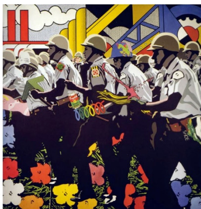
EQUIPO CRÓNICA: "Pim-Pam-Pop", 1971