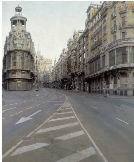
Gran vía, Antonio López 1974-81