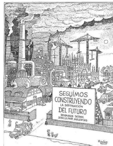
Seguimos construyendo la destrucción del futuro Quino