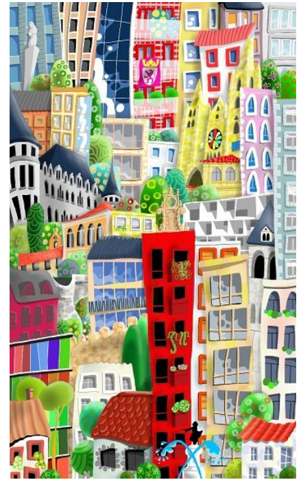
Ciudad de León