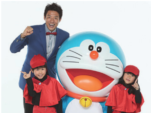
ドラえもんとおうえんだん 応援団